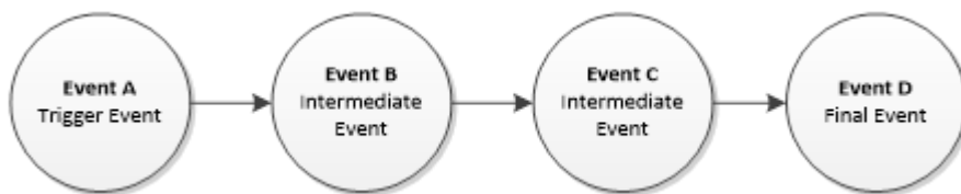
Figura 3: Catena di eventi

In conclusione, il principale valore aggiunto offerto da questo approccio è l'analisi delle relazioni causali, attraverso le quali i decisori possono esaminare passo dopo passo l'effetto a catena che da un evento scatenante "A", esogeno o endogeno alla SC, può portare conseguentemente a un evento indesiderato "D", attraverso eventi intermedi (ad esempio "B" e "C" nella figura 3). La conoscenza di questa catena di eventi può aiutare a prendere misure mirate per prevenire il verificarsi dell'evento "D". A volte, infatti, se gli eventi "A", "B" o "C" non si verificano, l'evento finale "D" non può avere inizio e quindi le sue conseguenze negative non possono verificarsi.